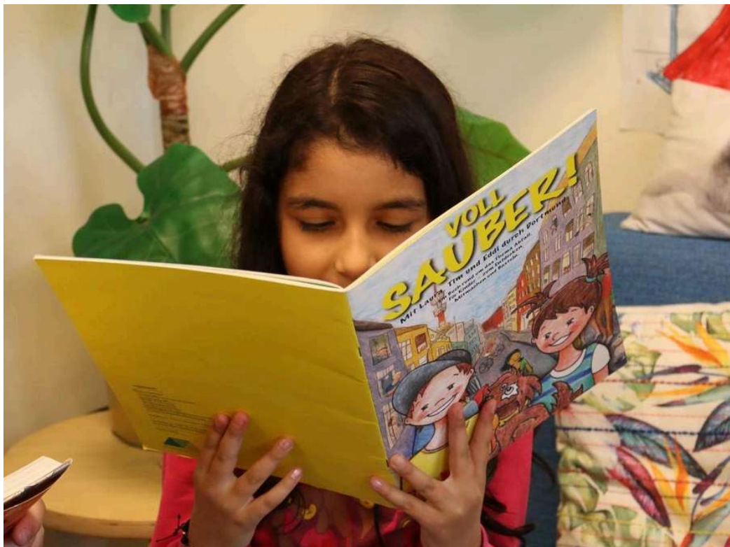
Im Haus der Vielfalt: Stanka (6) kann bisher nicht lesen, freut sich aber über die vielen bunten Bilder.

Von Tom C. Hoops, Digitalreporter 07.06.2026, 07:00 Uhr