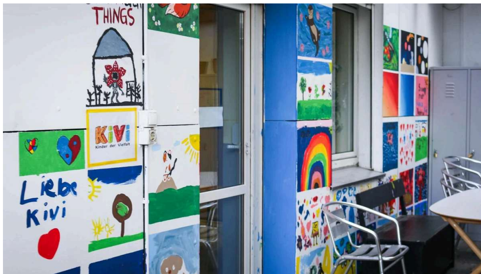
Auch an den Außenwänden können die Kinder sich verewigen.

„Die Kinder werden sich „meinen kreativen Vorschlag“, keine Case haben die Kinder abgelehnt“, sagt Toker lachend. Daneben steht ein Abenteuerschiff, auf dem sie spielen können. Gemeinsam mit den Kindern haben Toker und die anderen Mitarbeitenden außerdem ein Konzept für kleine Höhlen eingereicht, die mithilfe von Matten auf der Fensterbank gebaut werden können – und Fördergelder bekommen. Alles soll so gestaltet sein, dass die Kinder mitbestimmen können. Das spricht sich herum.