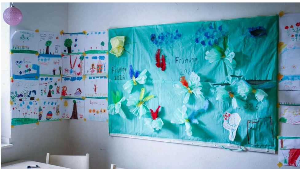
Die Gestaltung der KiVi-Räume haben die Kinder selbst übernommen.

An der Wand in der Bastelecke hängen gemalte Bilder und gebastelte Schmetterlinge aus Papier. Daneben ein Kalender mit ausgeschnittenen Cupcakes für die zwölf Monate. Auf jedem Monat stehen die Namen der Kinder, die dann Geburtstag haben. „Das haben sie zuhause oft nicht. Da gibt es keine Geburtstagsfeier, keine Geschenke“, sagt Toker. Vor der Wand steht ein gemütliches Ecksofa. Nichts Neues, kein Luxus. Aber für die Kinder, die hier Zeit verbringen, ist es viel wert.