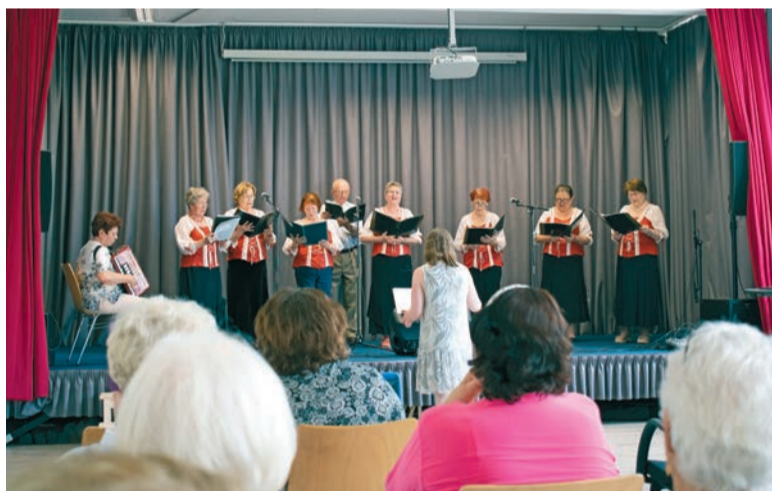
Russische Gesangsgruppe beim Seniorenfest