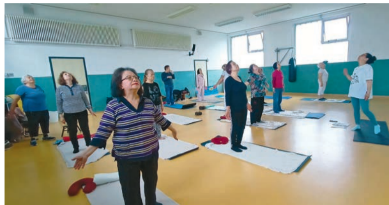
Yoga im Haus der Vielfalt

Am 24. Mai 2023 fand die erfolgreiche Veranstaltung "Gesundes Altern, Gesundheit im Alter" in türkischer Sprache im Haus der Viel-