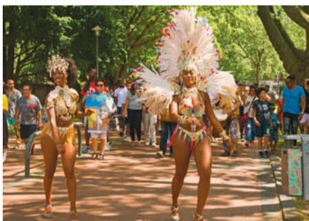
Impressionen vom Afro Ruhr Festival 2023