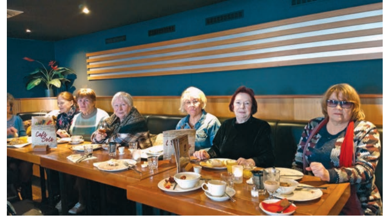
Seniorenfrühstück am Phoenixsee