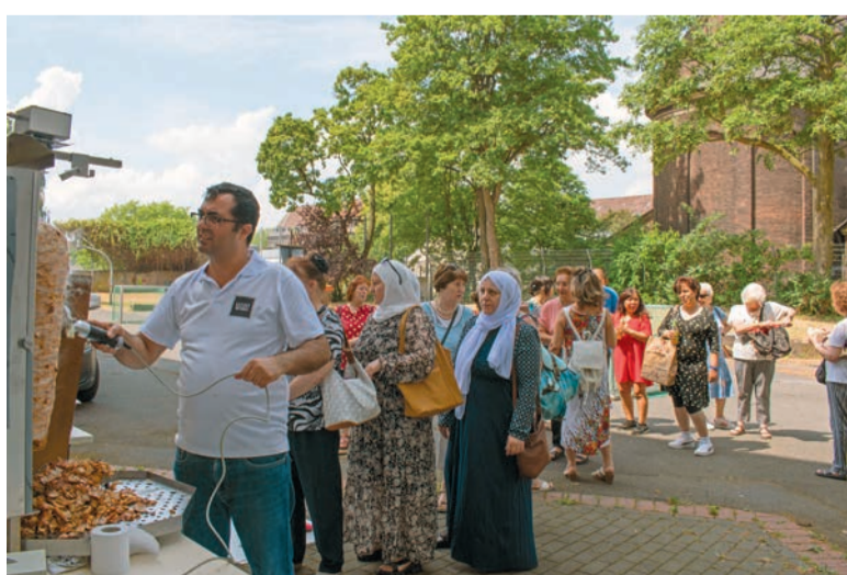
Dönergrillen im Hof am Haus der Vielfalt

projekts "Kultursensible Selbsthilfe" des Paritätischen NRW, den arabischsprachigen Seniorentreff des Projekts Kulsa. Dieser Besuch fand im Rahmen der Kooperation zwischen dem VMDO und dem Projekt "Kultursensible Selbsthilfe" statt, die seit November 2022 besteht. Das Ziel dieser Zusammenarbeit ist es, ein wichtiges und hilfreiches Gesundheitsangebot, die gemeinschaftliche Selbsthilfe, bekannter zu machen. An diesem Tag nahmen 27 Teilnehmerinnen und Teilnehmer am Seniorentreff teil, von denen zwei Interesse zeigten, eine Selbsthilfegruppe zu organisieren.