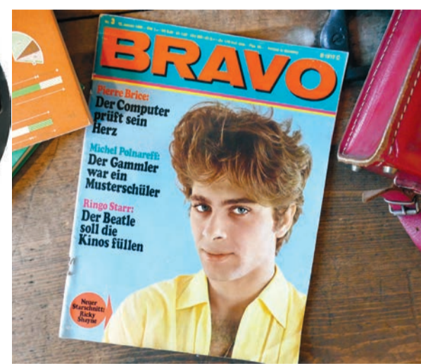
Ausgaben der Zeitschrift „Bravo“ von 1968 und Erstausgabe der EMMA (1977).

Schlaghose wurden immer beliebter. Gesellschaftliche, politische und kulturelle Ereignisse wie die Ölkrise und die Verbrenen der terroristischen Vereinigung RAF prägten die späten 1960er- und vor allem die frühen 1970er-Jahre. Zugleich wollten sich die jungen Menschen während der aufkommenden „Discowelle“ mit Besuchen in den Clubs und Discotheken von ihren Alltags-sorgen ablenken und ein Gefühl von Freiheit erleben. Individualität und Demokratie wurden zu wichtigen Werten, für die zunehmend junge Menschen auf die Straße gingen und sich bei Protestaktio-