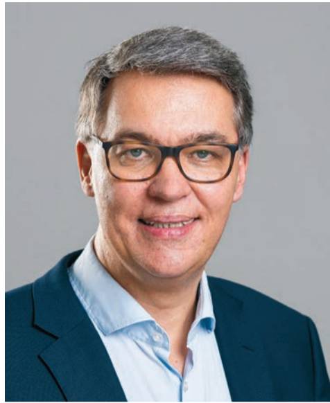
Oberbürgermeister Thomas Westphal

entgegenzuwirken. Wir unterstützen die Menschen finanziell, aber auch mit Beratung und Begleitung, damit sie ihren Wohnraum erhalten und ihre Lebenssituation stabilisieren können. Sollte der Verlust der Wohnung unvermeidbar sein, stehen wir mit unserem differenzierten System der Obdach- und Wohnungslosenhilfe den betroffenen Menschen zur Seite. Die Angebote reichen von den Notschlafstellen über begleitende Angebote bis zur Bereitstellung von Wohnraum. Am Ende wird immer das Ziel einer eigenen Wohnung oder Wohngemeinschaft verfolgt – je nach Bedarf, mit unterschiedlichen Formaten der Begleitung und Unterstützung. Ohne eine stabile Wohnsituation wird der Weg aus der Arbeitslosigkeit kaum gelingen können.