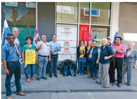
Protest gegen Asylkompromiss