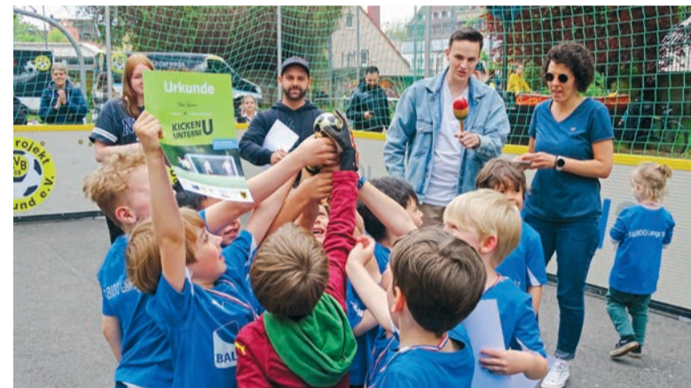
Siegerehrung nach dem Fußballturnier