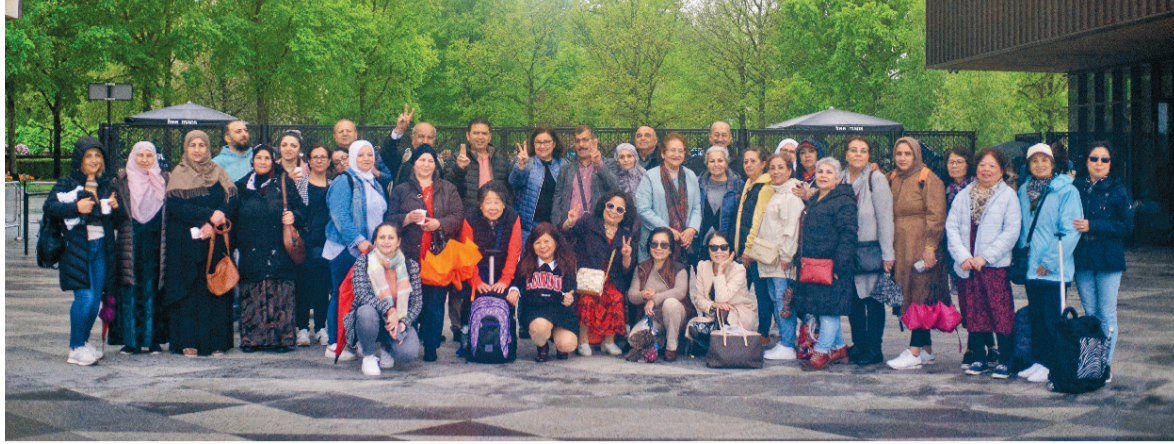
Seniorengruppen im Keukenhof Tulpenpark