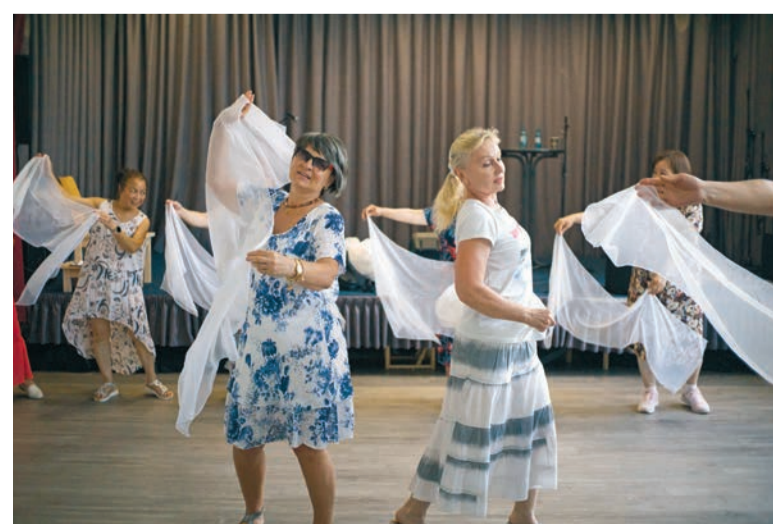
Tüchertanz beim Seniorenfest