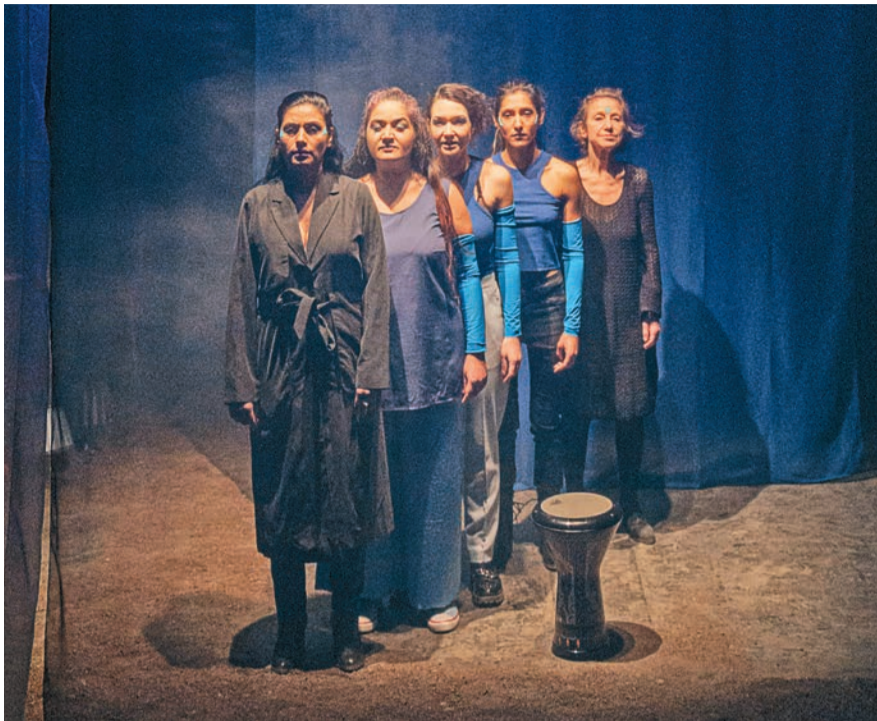
Szenenbild aus Bibi Sara Kali

Ein letztes Mal wollte Jelena den Bibijako Djive begehen und stieg deshalb in den Bus von Wien-Erdberg nach Boljevac, ihrer Heimatstadt in Serbien. Dort feierte sie – und dort starb sie tags darauf. Ihr Tod lässt ihre Töchter Snežana, Melisa und Tanja mit vielen Fragen zurück: Seit der Migration nach Wien vor dreißig Jahren, die die beiden älteren Schwestern als kleine Kinder miterlebt haben, gab es kaum noch Kontakt zur Familie in Serbien; und auch, dass die Mutter aufgebrochen war, um den Bibijako Djive zu feiern, ist verwunderlich, schließlich hatte sie in Wien ihre Identität als Romni geheim gehalten und ihre Töchter ohne Traditionen erzogen. Die drei Schwestern machen sich auf den Weg nach Boljevac, um ihre Mutter zu beerdigen. Antworten auf ihre Fragen finden sie dort weder in Tante Dragoslavas knappen Auskünften noch von Cousin Marcos Schnaps getränkten Fantasien einer besseren Zukunft in der EU. Aber sie finden