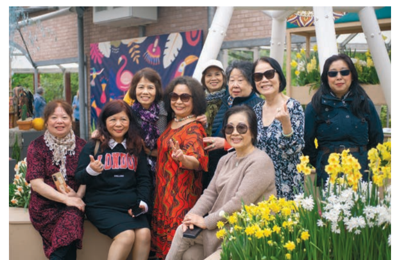
Vietnamesische Seniorengruppe im Keukenhof Tulpen Park