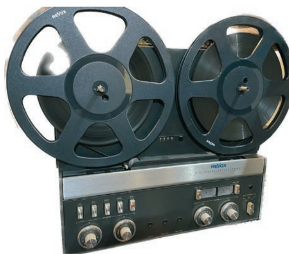
Tonbandgerät (Revox, ca. 1966)

Die Zeitreise führt weiter in die 1970er-Jahre, als die entstehende Hippie-Kultur die Wohn- und Modetrends beeinflusste. Florale Motive und Moden wie die